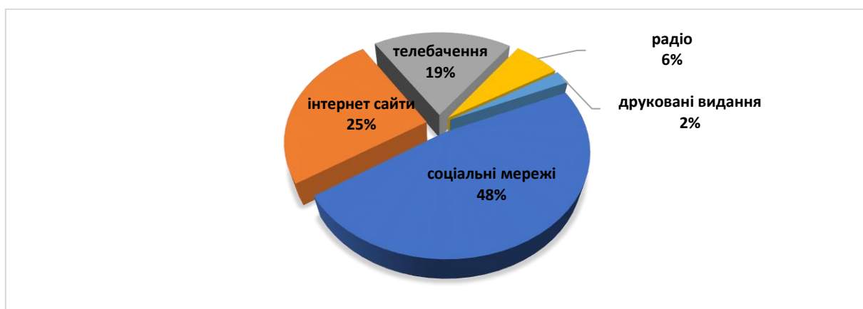
Рис. 2.1. Основні джерела українських новин у 2023 році 73

Роль окремих медіа з початку повномасштабного вторгнення росії на територію України змінилася. Основним джерелом новин у 2023 році стали соціальні мережі та інтернет сайти, на які припало 73% аудиторії, новини на телебаченні переглядали 19% опитаних, на радіо та друковані видання припало лише 8% споживачів медіапродукту.