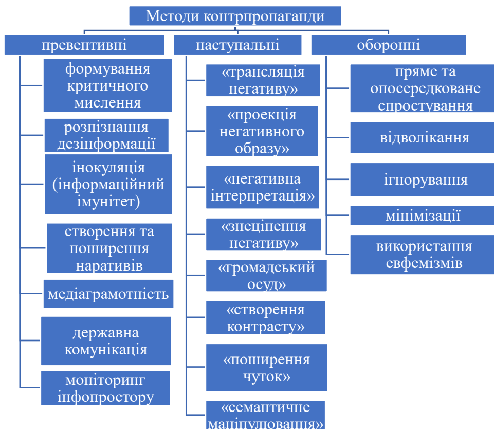
Рис. 1.1. Методи здійснення контрпропаганди 37

Виходячи із суті, мети та функцій контрпропаганди методи її здійснення можна розділити на превентивні, наступальні та оборонні.